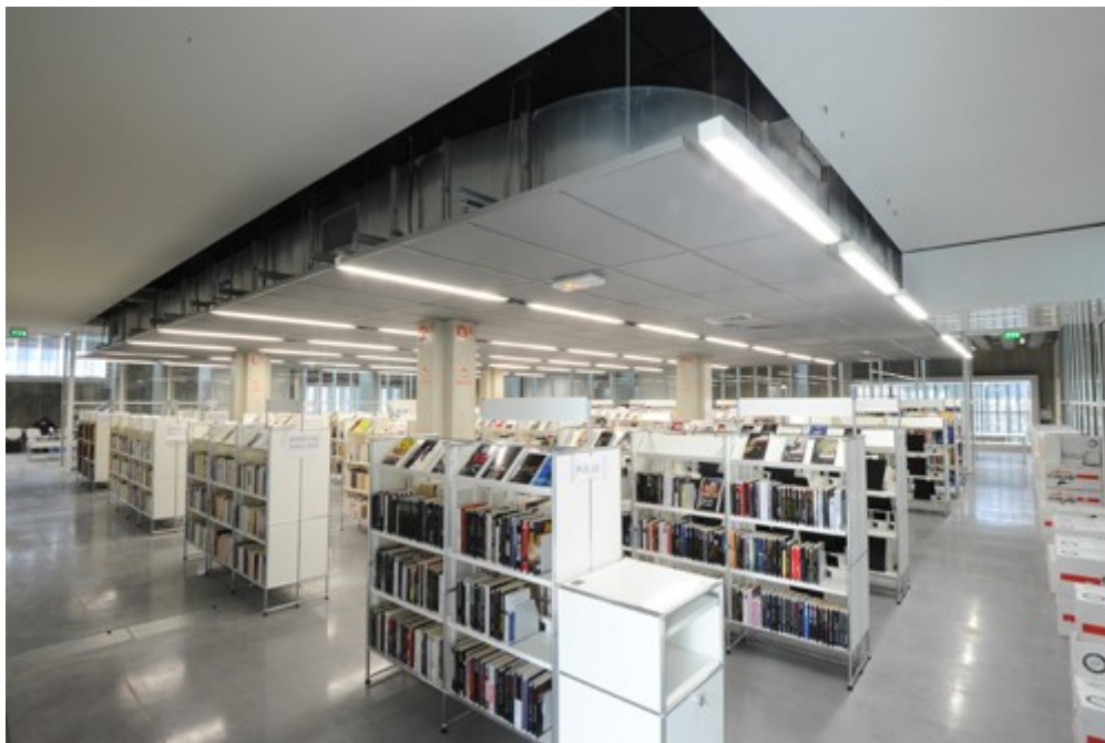
Illustration 3: Vue des étagères de la bibliothèque Grand M (Toulouse)

M » à Toulouse dispose d'étagères d'environ 1,5 mètre dont la partie supérieure est constituée d'un présentoir pour les ouvrages de face. Contrairement à ce qui est souvent l'habitude, ce type de présentation ne doit pas être réservé à la mise en avant de nouveautés mais doit vraiment être conçue comme un outil d'orientation au sein des collections.