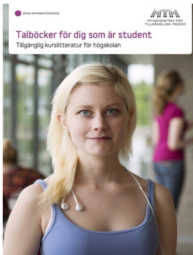
Illustration 4: Visuel de la plaquette de l'organisme suédois pour l'adaptation des documents

Les bibliothèques sont des lieux de découverte, de plaisir et de construction de soi. En somme, les lieux dans lesquels chacun et chacune peut se sentir libre de tracer son chemin parmi les milliers d'idées et de rêves que contiennent les documents de toutes sortes qui y sont proposés. Pour bien accueillir et servir les personnes en difficulté avec la lecture, les bibliothécaires devraient donc avant tout se penser en garant de cette liberté qui ouvre la possibilité du plaisir et du goût de lire. Et comme toutes les vraies libertés, celle-ci se décide et se construit collectivement.